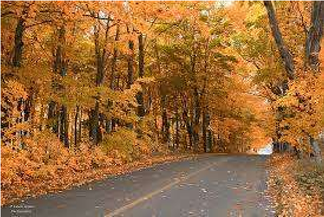
Route du Mitan, Saint-Jean I.O.