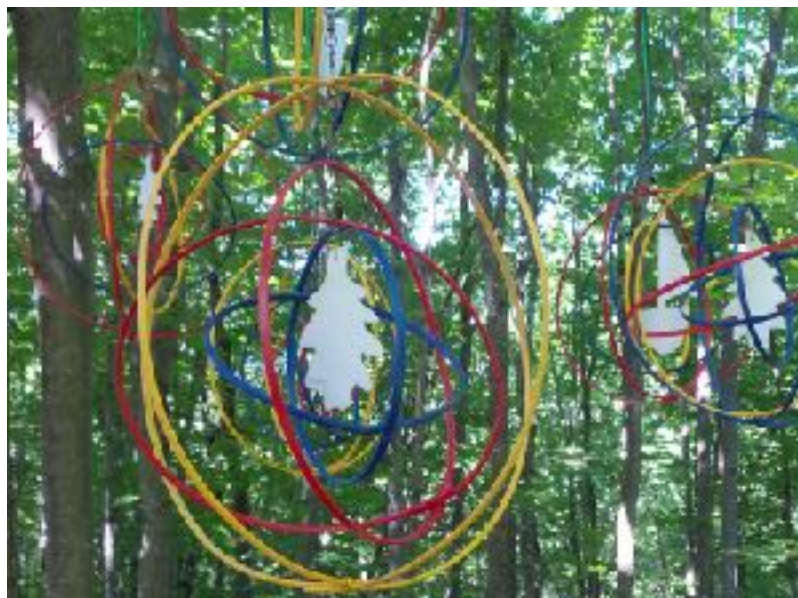
6- SENTIER DE L'ÉGLISE COLLECTIF ETC... DEPUIS 4 ANS.