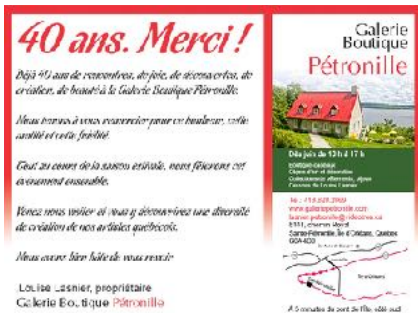
4- GALERIE-BOUTIQUE PÉTRONILLE LOUISE LASNIER DEPUIS 40 ANS